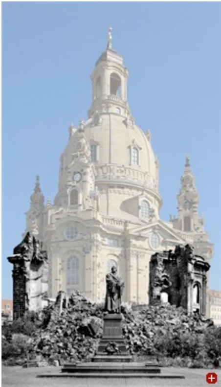
Ruine und Rekonstruktion der Frauenkirche in Dresden

17. September 2010 Wenn über ein Thema der Architektur besonders heftig gestritten wird, und das schon seit Jahrzehnten, dann über den Sinn oder Unsinn von Rekonstruktionen. Das betrifft nicht nur prominente Vorhaben wie den Wiederaufbau des Berliner Schlosses, sondern gilt ebenso für Projekte in kleineren Städten. Vor allem in Deutschland erwecken derlei Debatten den Eindruck von Glaubenskriegen: Auf der einen Seite stehen meist Bürger und Politiker, die auf Rekonstruktionen verlorener Bauten dringen, auf der anderen Denkmalpfleger und Architekten, die sie radikal ablehnen. Deshalb ist es mutig, dass und wie sich nun das Architekturmuseum der TU München dieses Reizthemas angenommen hat.