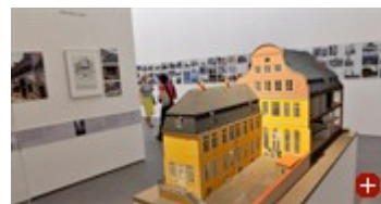
Modell des Lübecker Buddenbrookhauses

Wie von Münchens Architekturmuseum gewohnt, dient auch diese Schau der Aufklärung. Sie richtet sich gegen das Freund-Feind-Schema der Rekonstruktionsdebatte und setzt ihm die historischen Tatsachen entgegen. Unter dem Oberbegriff „Wiederherstellung“ bezeugt sie von Japan über Polen bis hin nach Kanada die überraschende Bandbreite derartigen Bauens - vom völligen Nachbau historischer