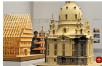
Modelle der Frauenkirche in Dresden (r), des Knochenhaueramtshauses (l) in Hildesheim und des Chinesischen Turms in München

Die Ausstellung nimmt Partei für diese historischen Entwicklungen, aber nicht für jedes ihrer Beispiele. Geradezu enzyklopädisch werden auch fragwürdige und misslungene Rekonstruktionen gezeigt. Zu den Grotesken gehört das 2009 eröffnete Einkaufszentrum am Mainzer Dom, bei dem eine schmale Reihe „historisch“ nachempfunderer Markthäuserfassaden mit einem plumpen modernistischen Anbau von Massimiliano Fuksas zu einem Ensemble zwangsvereint wurde.