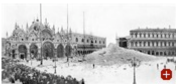
Campanile von San Marco in Venedig. Man schwor sich, den Schuttberg, originalgetreu wieder aufzubauen

„Konservieren, nicht restaurieren“: der hiesige, um 1900 entstandene Grundsatz der klassischen Denkmalpflege bezog seine Berechtigung daraus, dass Deutschland noch eine Überfülle an historischen Bauten besaß. Und nach dem Zweiten Weltkrieg war es beim legendären Streit um das zerbombte Frankfurter Goethehaus berechtigt, aus politisch-historischen Gründen eine Rekonstruktion