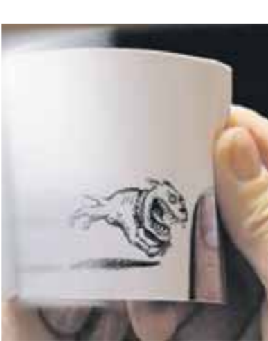
Da rennt der Hund. Aber nur, wenn der Daumen ihn in Trab setzt.

Den Verlag, der ein reines Familienunternehmen ist, gründete er 1998 gemeinsam mit seinem Bruder Michael. Beide hätten einen Verlag für optische Spielzeuge im Sinn gehabt und deshalb außer Daumenki-