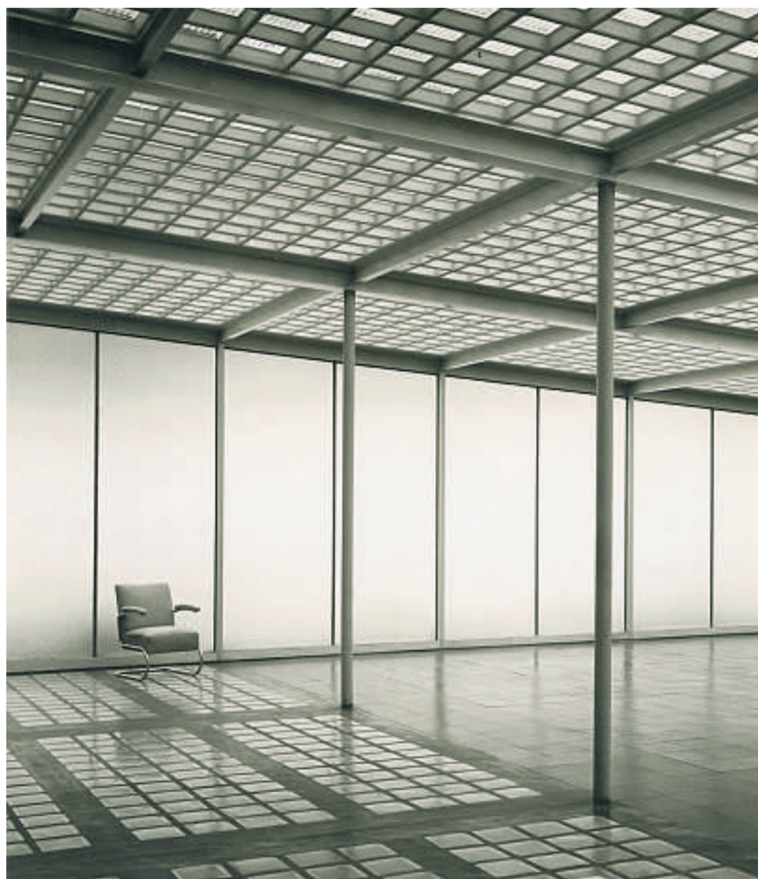
Nüchtern sachlich – Haus der Glasindustrie in Düsseldorf, 1951. BERNHARD PFAU

Die fotokünstlerischen Interpretationsmöglichkeiten für sich zu nutzen wussten Herzog & de Meuron, als sie 1991 so unterschiedliche Temperamente wie Balthasar Burkhard, Thomas Ruff, Margherita Spiluttini und Hannah Villiger beauftragten, ihr Schaffen im Schweizer Pavillon auf der 5. Architekturbiennale in Venedig zu reflektieren. Spätestens seit dieser denkwürdigen Schau feiert der künstlerische Blick auf das Gebaute – von Günther Förg bis Jeff Wall – in einer Vielzahl von Ausstellungen Triumphe. Gleichwohl spiegelt sich auch die zeitgenössische Architektur vornehmlich