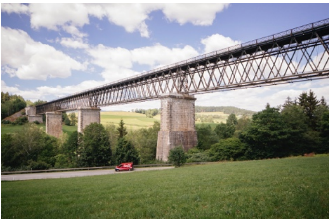
Regen, Eisenbahnbrücke über die Ohe, 1877 Heinrich Gottfried Gerber