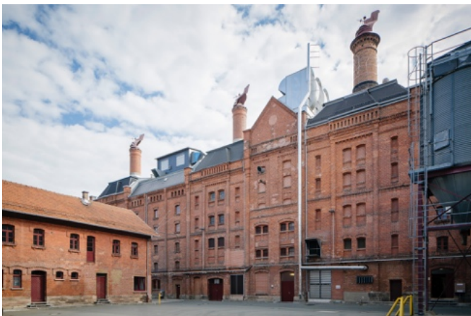
Kulmbach, Meußdoerffer'sche Malzfabrik (heute Ireks GmbH), 1883