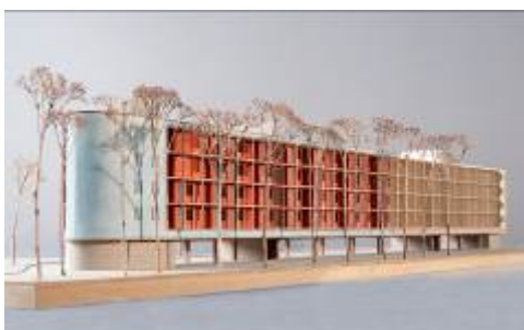
Florian Nagler Architekten, Wohnanlage Dantebad, München, Modell 2015