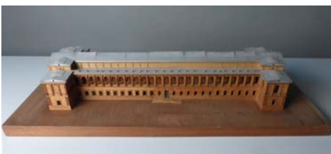
Hans Döllgast, Wiederaufbau der Alten Pinakothek, Modell 1946