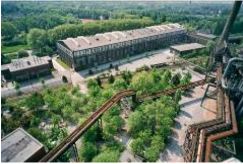
Latz + Partner, Landschaftspark Duisburg- Nord, 2002