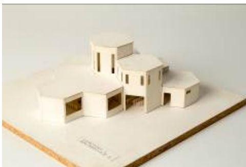
Lichtblau & Bauer, Evangelische Versöhnungs- kirche, Geretsried, Modell 1969