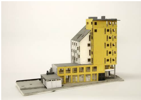
Modell eines Wohn- und Geschäftshauses mit Kinos von Otto Steidle, München 1994-1999

All images can be found on the Press Department's online download http://www.pinakothek.de/ueber-uns/presse . These images may be used free of charge for editorial reporting on this exhibition (according to § 50 UrhG) at the earliest 3 months before the beginning of the exhibition and up to 6 weeks after the end of the exhibition, on condition that the photographer and the copyright holder are credited as the source. The images may not be bled, cropped, guttered or overprinted. Use for social media purposes is not permitted without permission.