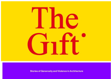
Logo der Ausstellung. Grafikdesign: Wiegand von Hartmann (WVH)

All images can be found on the Press Department's online download http://www.pinakothek.de/ueber-uns/presse . These images may be used free of charge for editorial reporting on this exhibition (according to § 50 UrhG) at the earliest 3 months before the beginning of the exhibition and up to 6 weeks after the end of the exhibition, on condition that the photographer and the copyright holder are credited as the source. The images may not be bled, cropped, guttered or overprinted. Use for social media purposes is not permitted without permission.