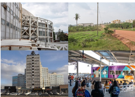
Die vier Städte heute: Oben links: Universal Hall in Skopje, N. Mazedonien; Oben rechts: KNUST Universi- täts-campus in Kumasi, Ghana; Unten links: Microdistrict III und IV in Ulaanbaatar, Mongolei; Unten rechts: Bloomhouse, Em- erson Collective in East Palo Alto, CA, USA.